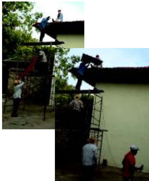
村人の一致協力で屋根は修復

ソヤでは、教会の改修が始まりました。2年前のチアパス直撃の大地震で落ちた聖堂の屋根