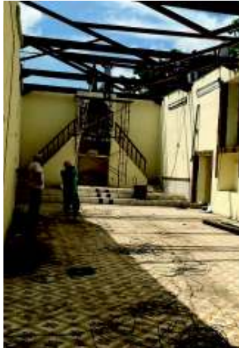
修復を行なう教会内部