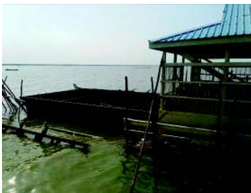
建物から大きな木の箱を取り出す

普段運動公園は、授業の休み時間に、子ども達が走り回って遊んでいます。水上で生活している子ども達は、学校に来た時にはとても楽しそうに走り周り遊んでいます。しかし工事期間中は、運動公園は立ち入り禁止でしたが、完了後はまた子ども達が安全に遊ぶことが出来るとも喜んでいました。