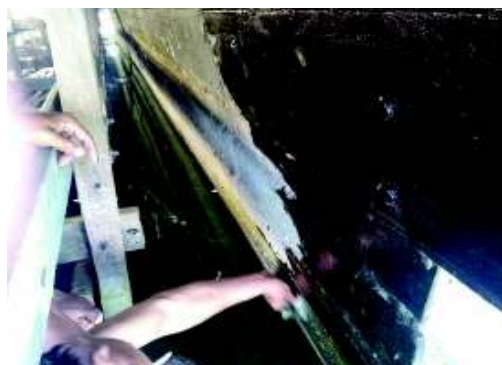
防水剤を塗布している様子

運動公園の修理は、大きな木の箱を建物から取り出す必要があります。普段は、固定されていますので、釘などを取り外して、大きな木の箱に大量の水を入れます。大量の水が入る事により、大きな木の箱が沈み、建物から引き出すことができます。そして、箱を水から上げて、木で組んだ枠組みの上に、ひっくり返して置いて乾燥させます。その後、洗浄、木の補修、防水剤を3度塗っていきます。また運動公園の大きな木の箱は2つあるため、一つずつ修理しました。