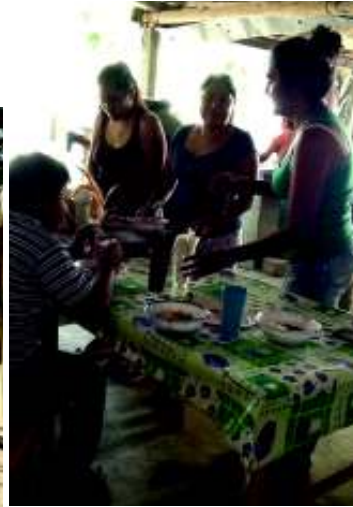
修復を支える女性たち

の補修が、8月5日に完成しました。すべて村人達の手でなされたのです。全部手仕事でした。クレーン車も、シャベルカーも何もナシ。全てが人間の手でまかなわれていました。老人も女、こどもも一致協力。休み返上で行われました。「聖堂の修復作業は、政府が行う」の宣言は何処に行ってしまったのでしょうか？村人達の一