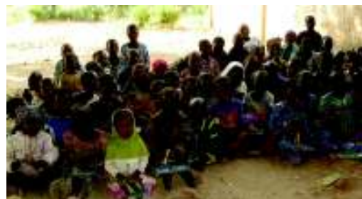
ライ コロン村の子供たち