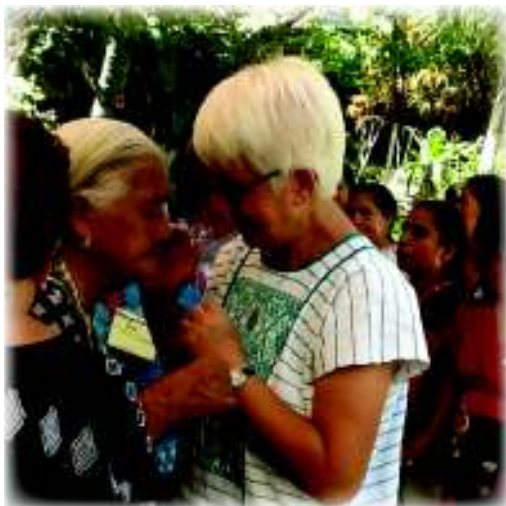
ロサとの別れをおしむ人々